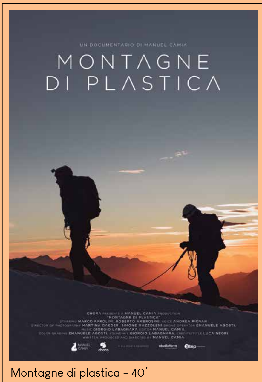
Montagne di plastica - 40'

presentazione dei documentari e dello studio sulla contaminazione da plastica e microplastica e talk sulla comunicazione ambientale