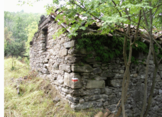
Essicatoio lungo il percorso