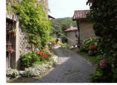
Ca di Lemmi